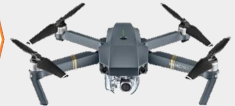
БпЛА КТ (тяжелые)